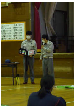
AEDの使い方について学びます