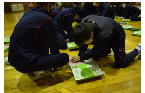
協力して押します