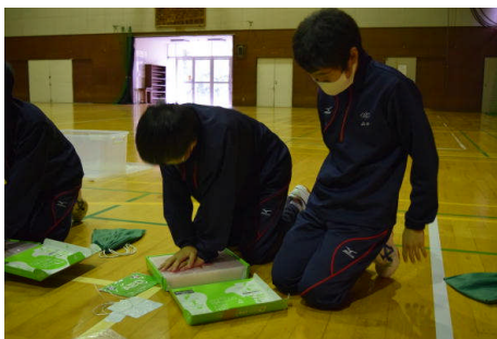
一人で10分間は大変なので