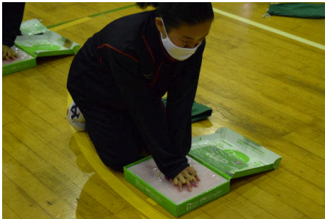
2分間一人で押します