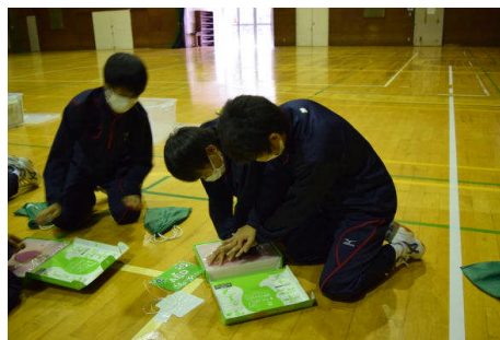
素早く交代して押します