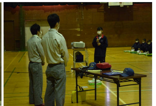
お礼のあいさつをします