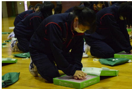
ひたすら押します